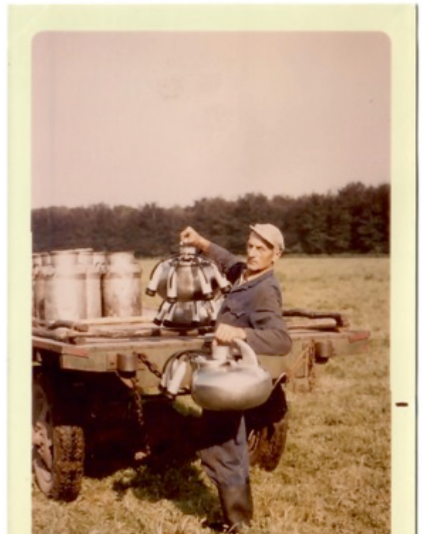
Afbeelding 4 Melken op de ouderwetse manier