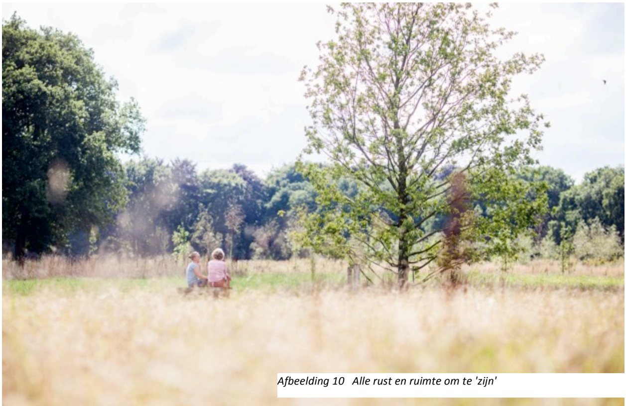
Afbeelding 10 Alle rust en ruimte om te 'zijn'