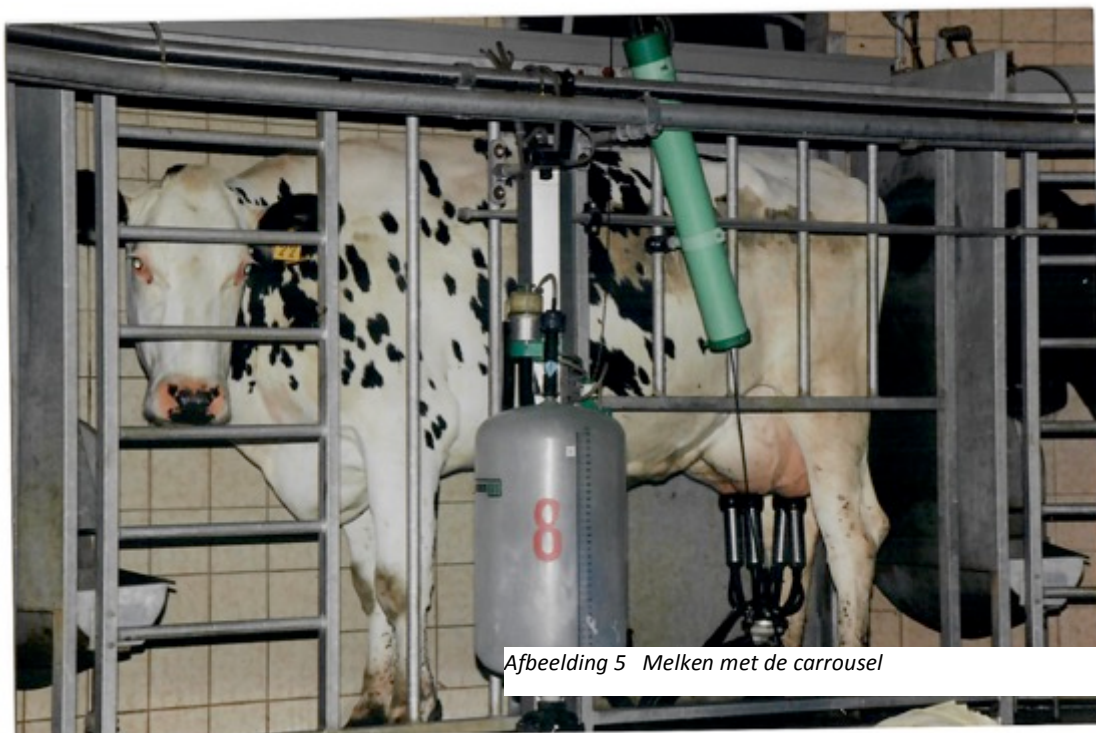
Afbeelding 5 Melken met de carrousel