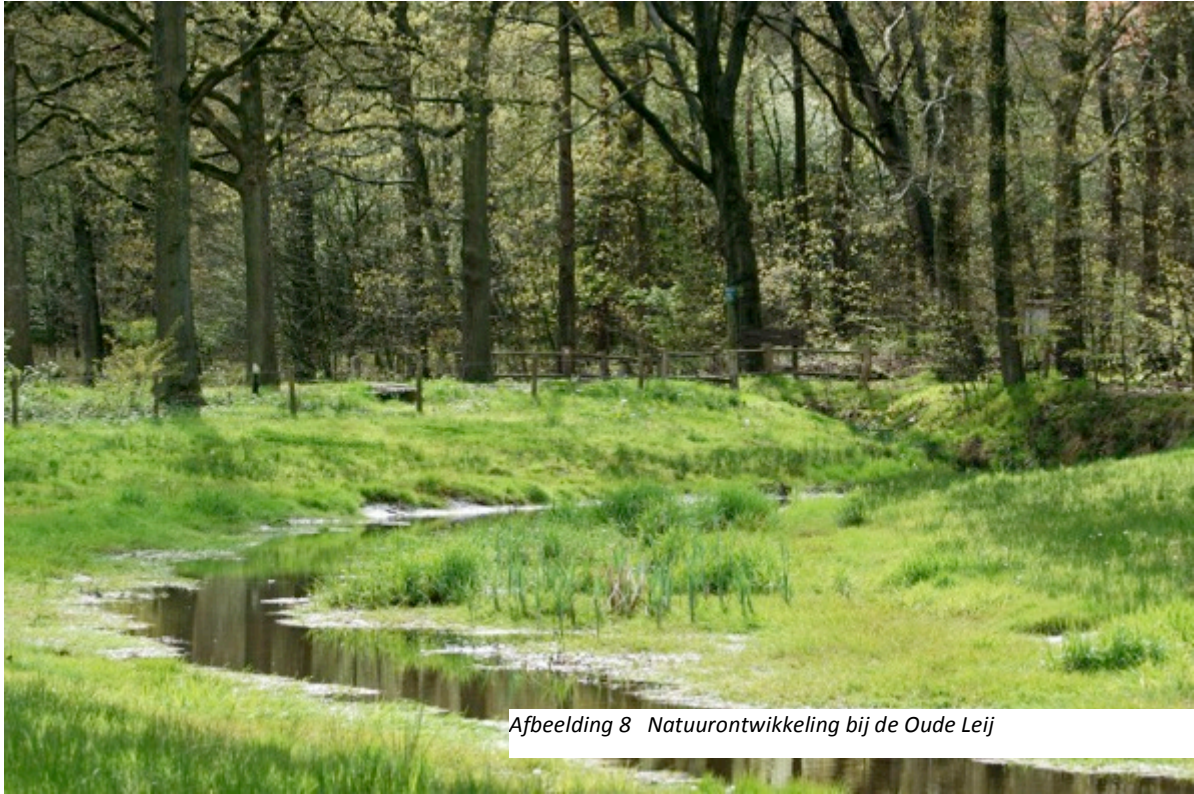
Afbeelding 8 Natuurontwikkeling bij de Oude Leij