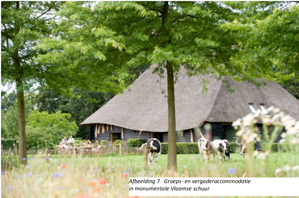
Afbeelding 7 Groeps- en vergaderaccommodatie in monumentale Vlaamse schuur