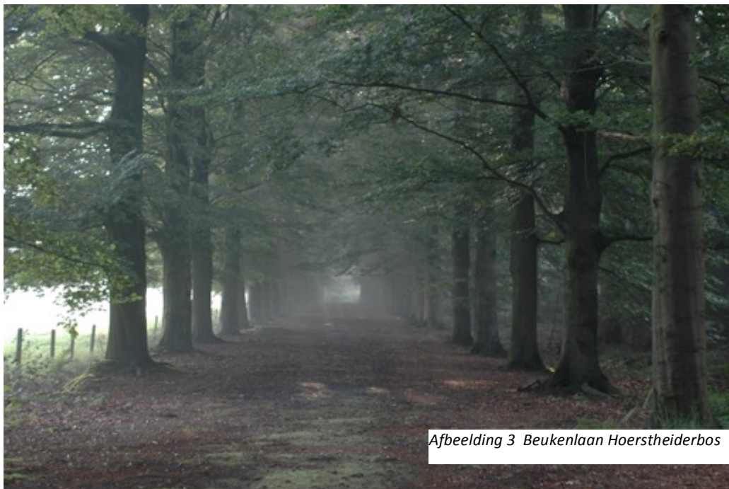
Afbeelding 3 Beukenlaan Hoerstheiderbos