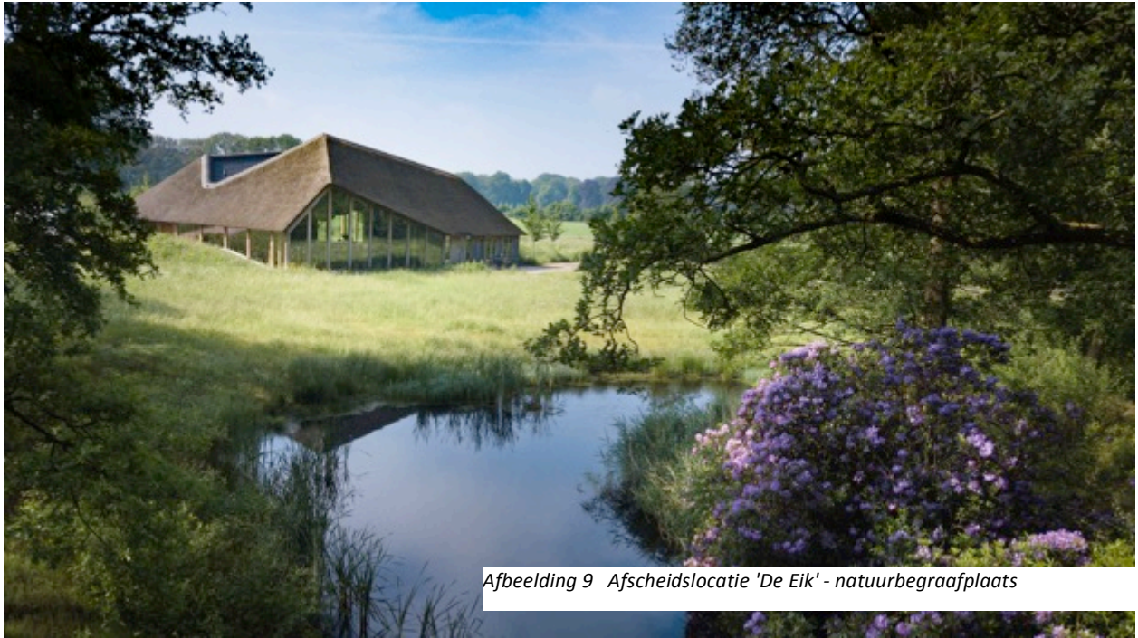
Afbeelding 9 Afscheidlocatie 'De Eik' - natuurbegraafplaats

Inmiddels zijn er 4 kinderen geboren in het gezin Van der Lande-Vogels. Floris en Caroline zijn sterk verbonden met De Hoevens en het lijkt hen een mooie gedachte om ooit op het landgoed begraven te worden. Tijdens een gesprek met de gemeente Goirle komt het idee op tafel. In 2009 krijgen ze toestemming voor een familie-begraafplaats op het landgoed. Tijdens een wandelvakantie in Engeland doen ze een jaar later inspiratie op. Voor de aanleg van de natuurbegraafplaats worden voormalige landbouwgronden teruggegeven aan de natuur, worden 5200 vierkante meter aan bedrijfsgebouwen afgebroken en wordt een landschapsplan ontwikkeld. Van de voormalige kalverstal wordt een informatiecentrum gemaakt. En er wordt een prachtige afscheidlocatie gerealiseerd. Na jaren van voorbereiding wordt in 2014 de natuurbegraafplaats geopend.