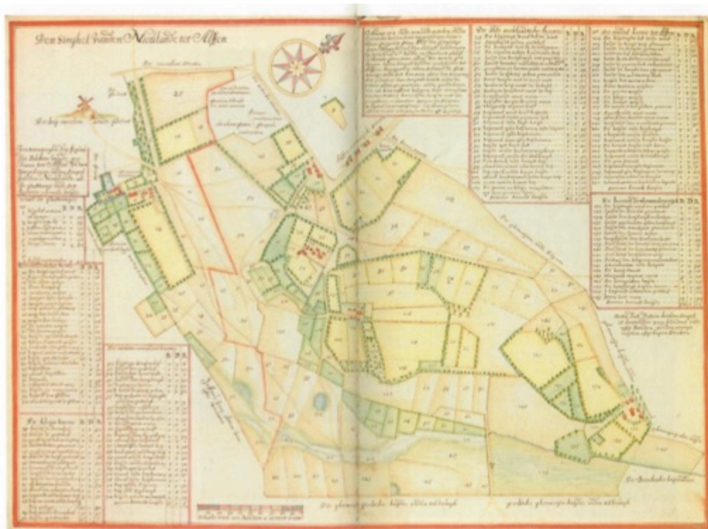
Afbeelding 1 Landkaart Singel van de Nieuweland (1714)

De geschreven geschiedenis van De Hoevens begint echter in 1204, wanneer de Nieuwelandse Hoeve door de Heer van Breda aan de Abdij van Tongerlo wordt geschonken. Het jaar daarop volgt het Hof ter Zande op Kwaalburg en in 2016 krijgt de abdij van de Heer van Breda als derde hoeve De Leeuwerkeneik geschonken. Veel later pas, in de 16 e eeuw, volgen de Pastoriehoeve en de Kleine hoeve en in 1622 de Middelhoeve, die later Grote Hoeve heet. Deze hoevens worden allemaal door de Norbertijnen ontgonnen en met pachters bezet. Zo'n pachtcontract kende vele verplichtingen. Verplichtingen met betrekking tot het inrichten en beheren van zo'n hoeve, maar ook verplichtingen betreffende hand- en spandiensten voor het overig abdijbezit, zoals voor de kerk van Alphen. Een pachtcontract werd meestal afgesloten voor 6 jaar telkens vanaf half maart, en kende een vast pachtbedrag in geld, het zogenaamde "voorlijf". Daarnaast ook huur dat moest worden voldaan met graan, zaad, was, boter en kaas. Pachters hadden het niet altijd gemakkelijk. Niet alleen door oorlogen en plunderingen (Maarten van Rossum, Spaanse leger) maar ook door misoogsten en persoonlijk leed zoals de pest en vroege sterfte van de pachter. Op een fraaie landkaart van de Singel van de Nieuwelande uit 1714 kun je zien hoe welvarend de pastorie en de 6 hoeven van Tongerlo er toen bij lagen!